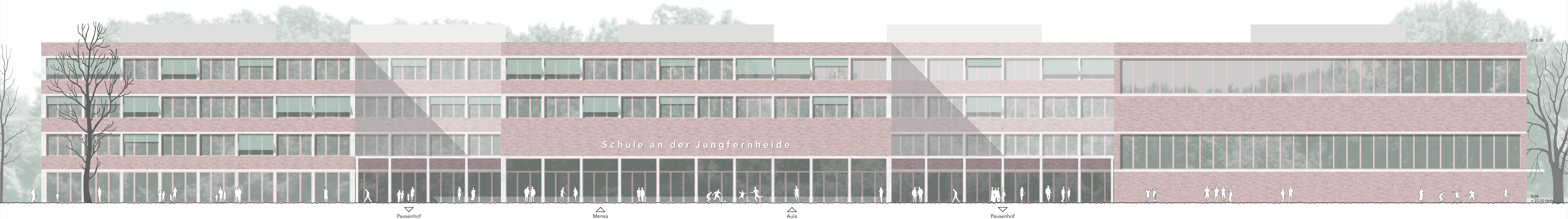
Südfassade 1 : 200