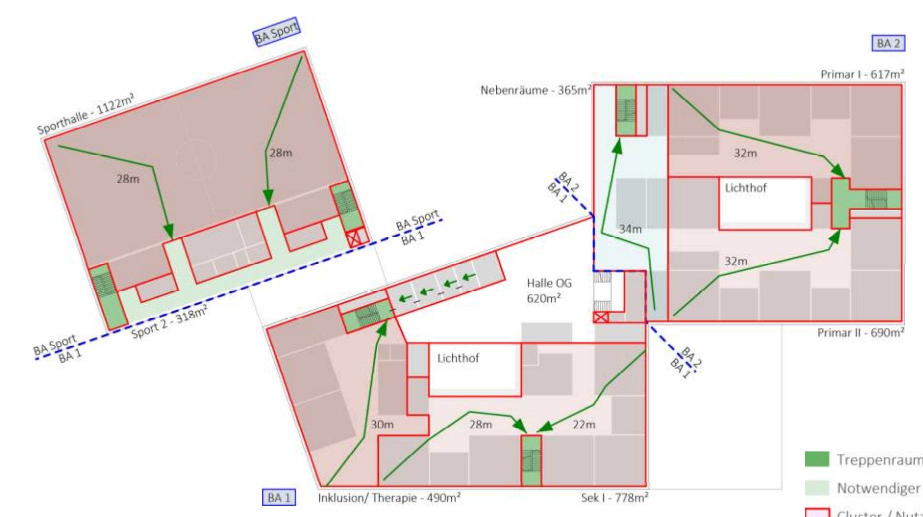
Piktogramm - Brandschutz Regelgeschoss