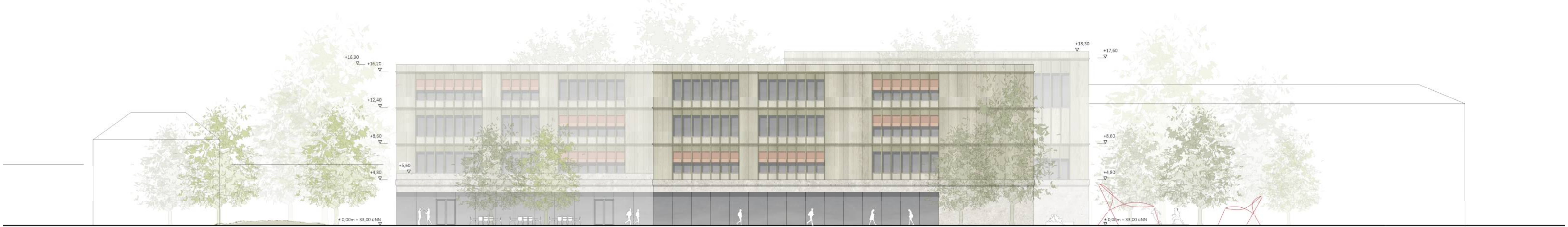
Ansicht Osten 1:200 | Blick auf die Mensa