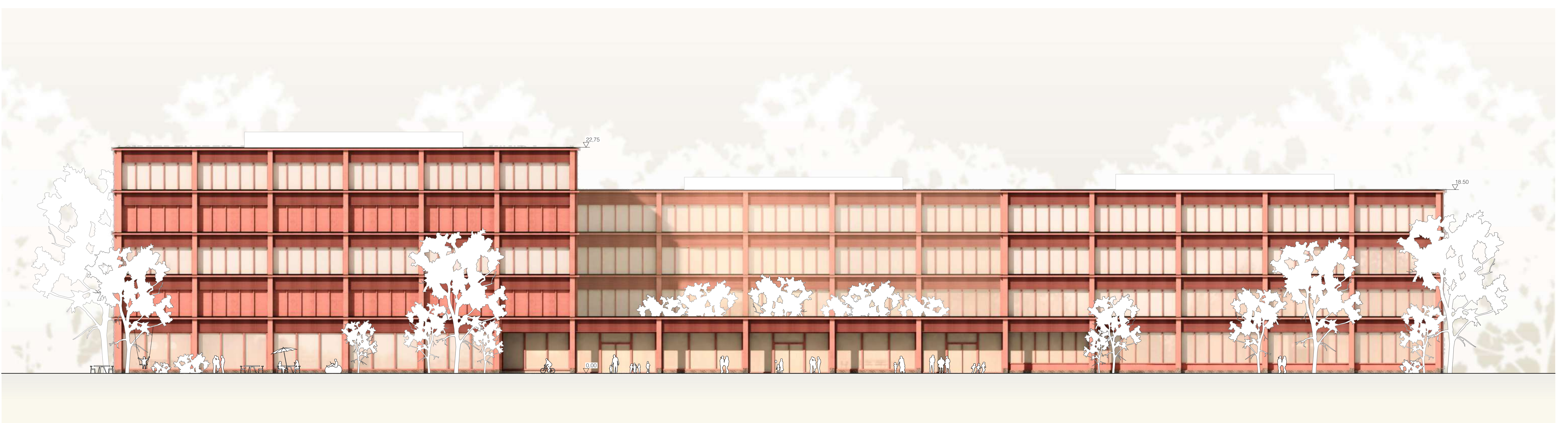
Ansicht Süd 1:200