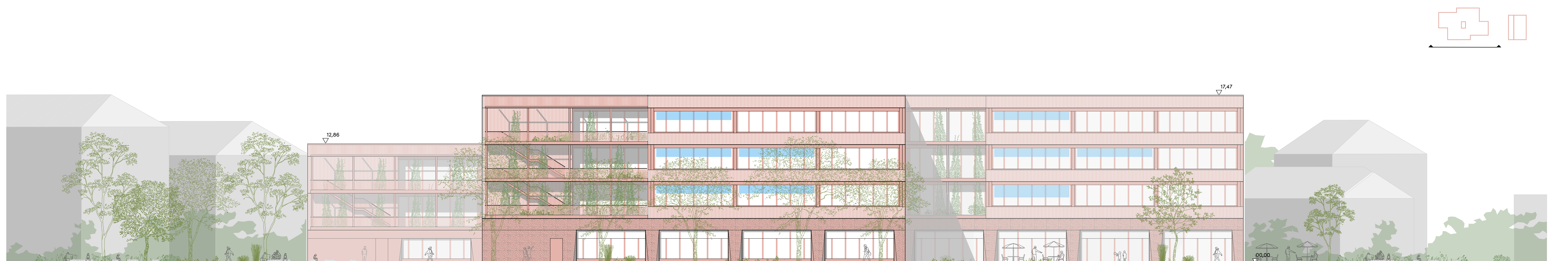
Schule Ansicht Süd | Maßstab 1:200