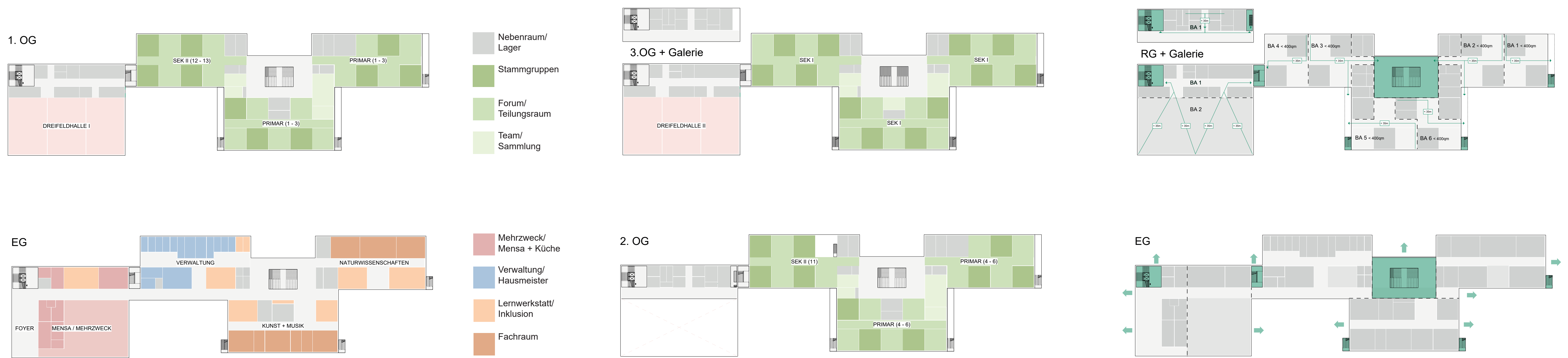
FUNKTIONSVERTEILUNG EG + 1.OG