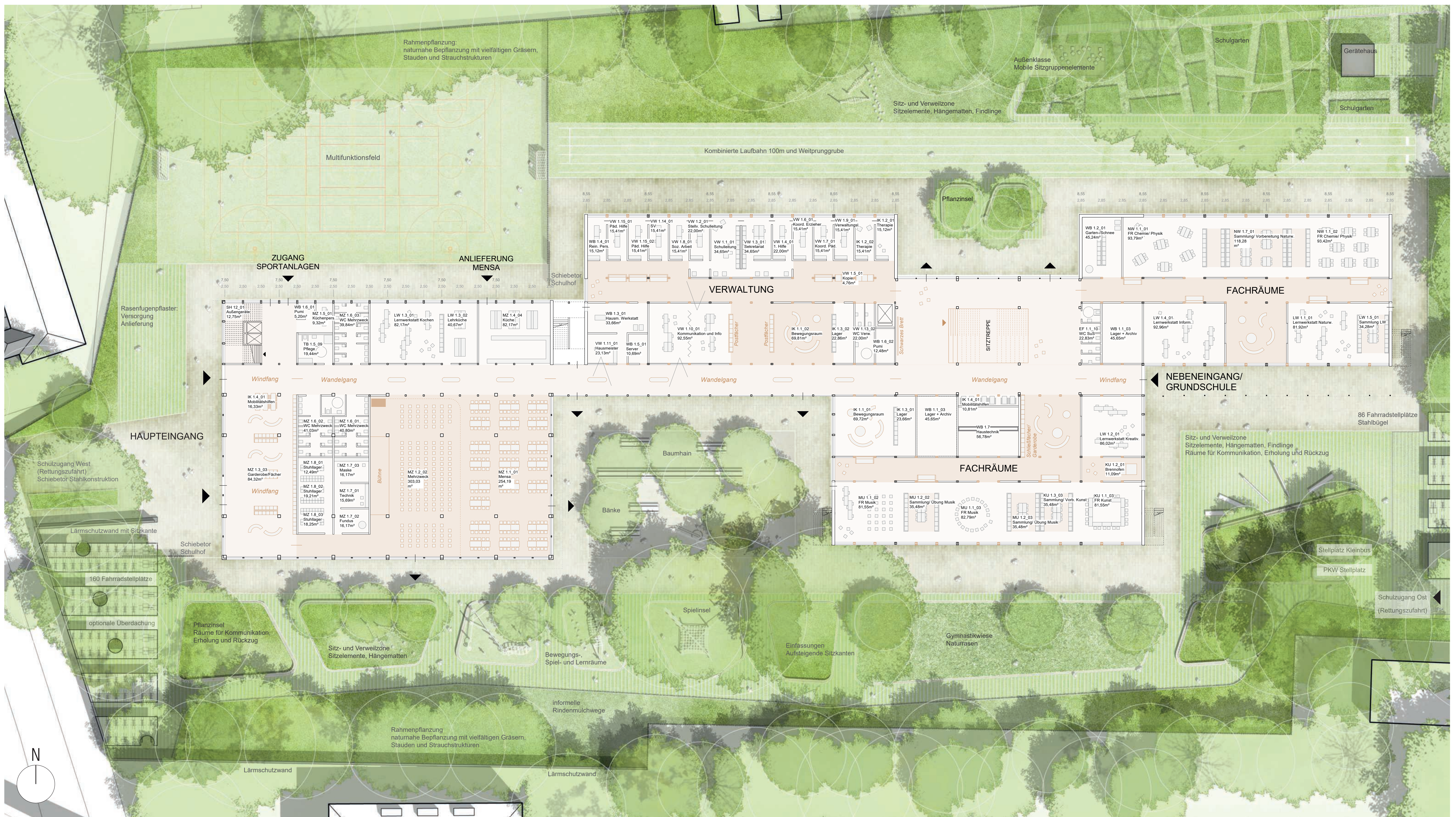
GRUNDRISS ERDGESCHOSS M 1:250