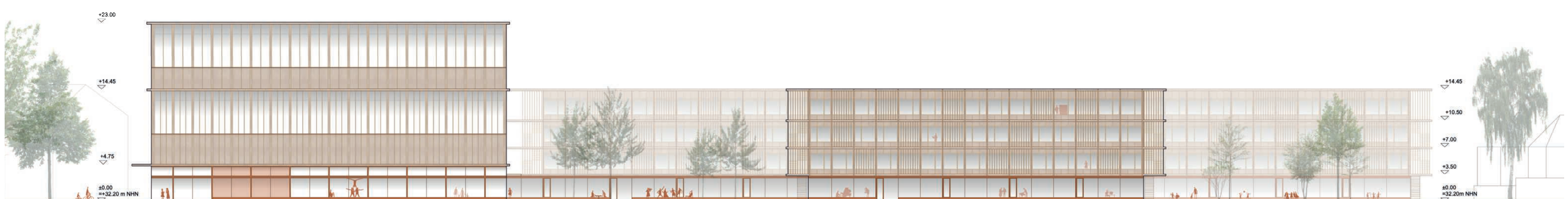
ANSICHT SÜD SCHULHOF M 1:250