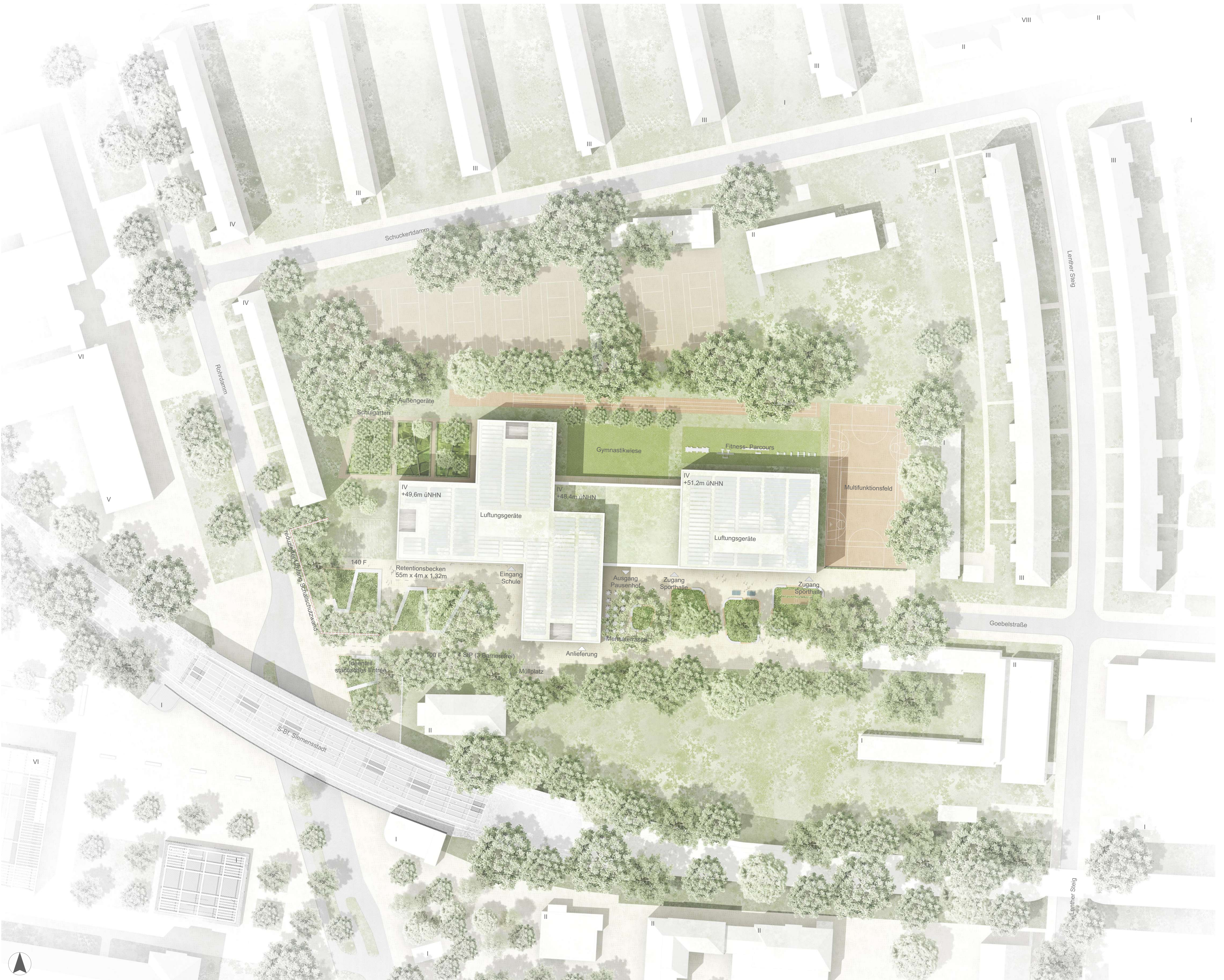
LAGEPLAN M 1:500

Der Süden - Vorplatz und Schulhof Der südliche Bereich des Schulgeländes wird durch den Vorplatz, Schulhof und den durch den alten Baumbestand gesäumten Hauptzuweg definiert. Unterschiedlich priorisierte Wege verbinden den Neubau mit dieser Magistrale. Der alte Baumbestand wird weitgehend erhalten und großzügig in Baumscheiben freigestellt. Die Baumscheiben werden als Bestandteil des Schulhofes von großzügigen Holzdecks und raumbildenden Spielgeräten auf unversiegelten Fallschutzelagen besetzt. Pfade, freies Spiel, Totholz, Holzocker zum Sitzen und Hüpfen, Slacklines, Findlinge und neue Unterpflanzungen runden hier das Angebot des Schulhofes ab. Die Decks unter den Bäumen können außerhalb der Pausen als Grüne Klassenzimmer genutzt werden. Angrenzend an den Neubau wird der Schulhof befestigt und nimmt weitere Bänke Sonnenschirme und Tischtennisplatten auf.