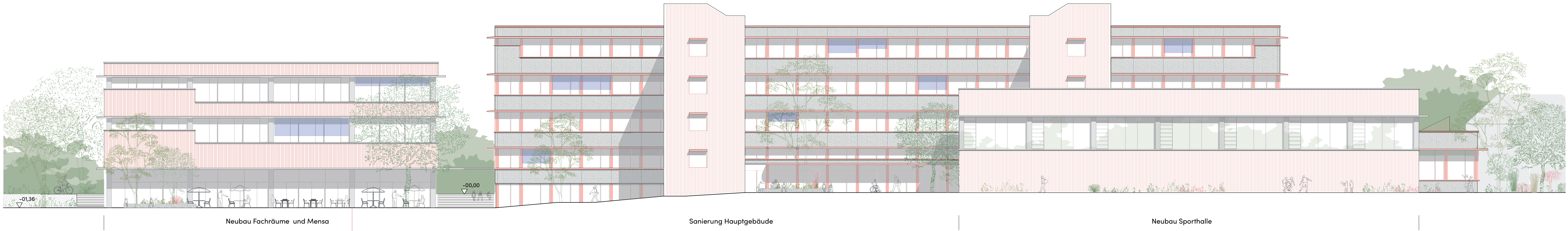
Ansicht Süd | Maßstab 1:200