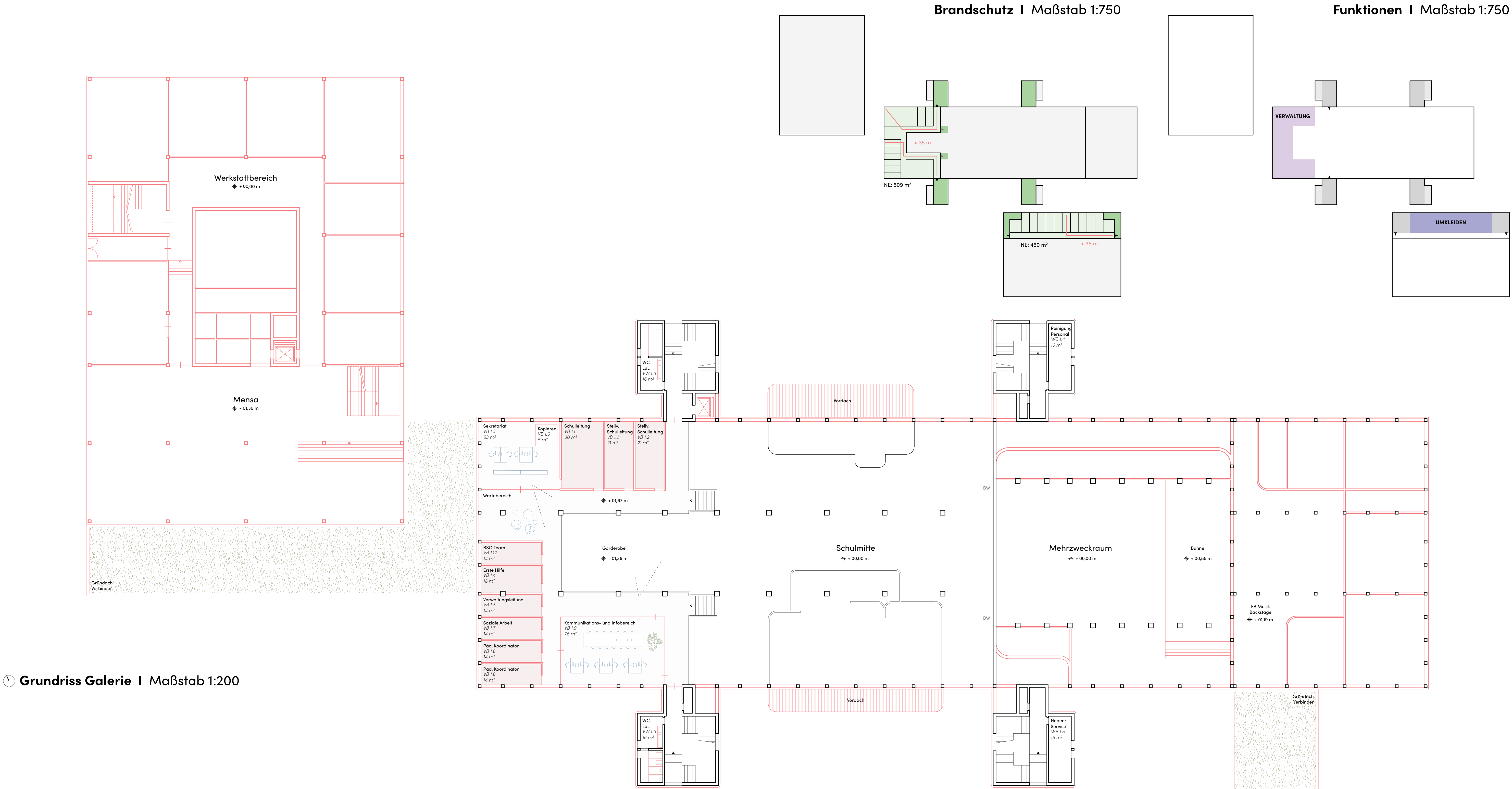
Grundriss Galerie | Maßstab 1:200