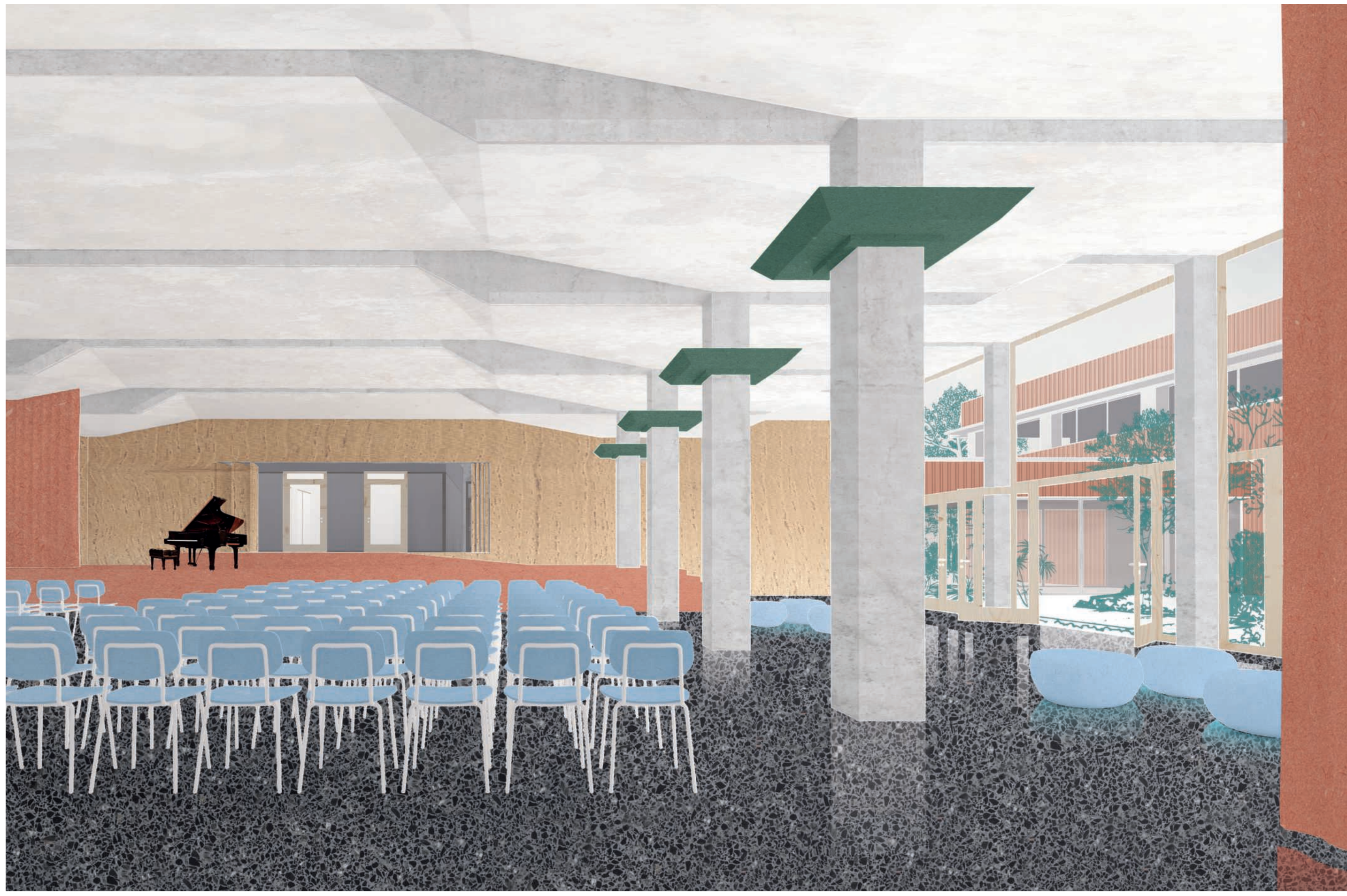
Übergangsraum | Die Gemeinschaftsbereiche bilden im Erdgeschoss die Verbindung zwischen Neubau und Bestand.