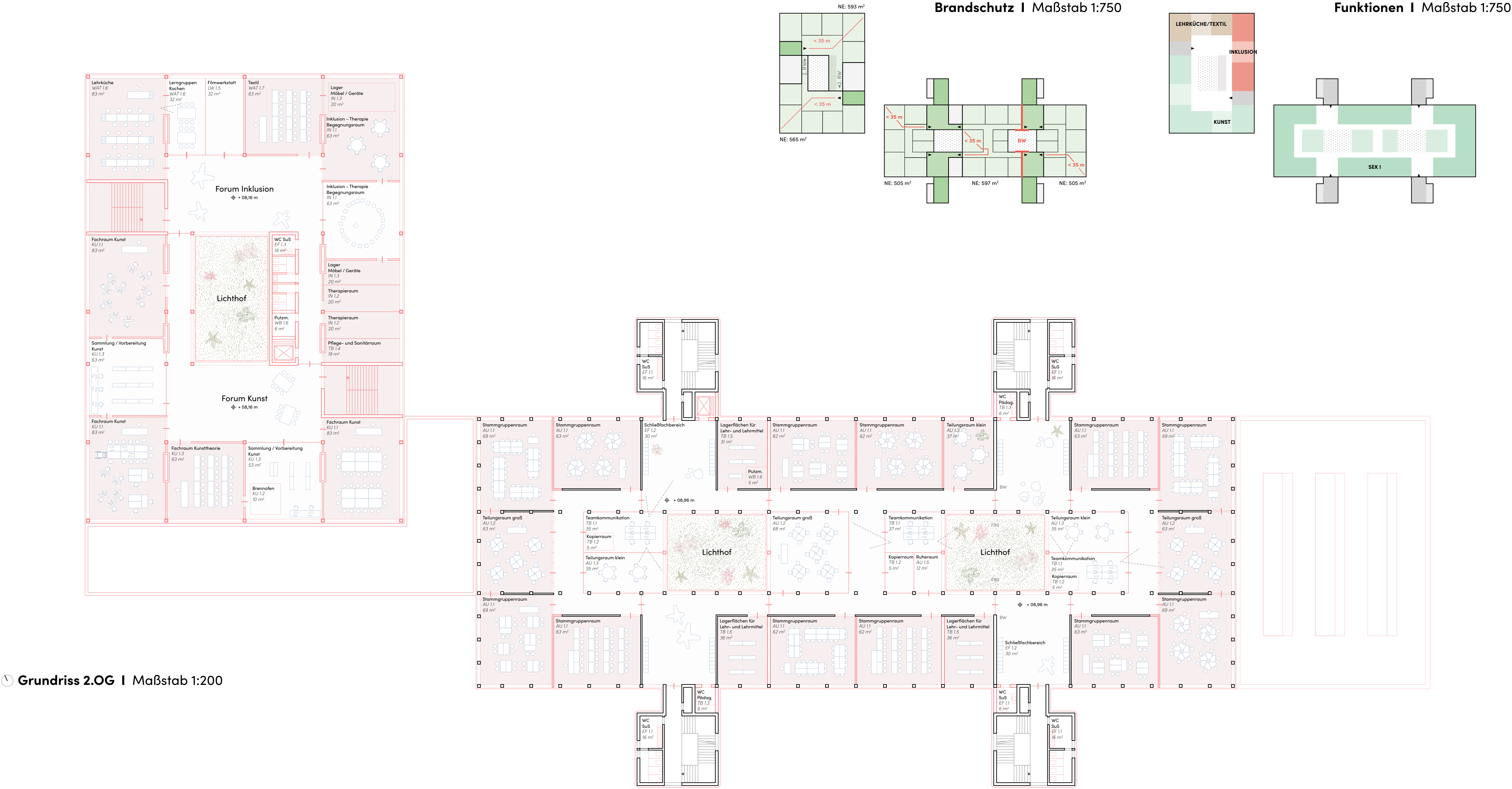
Grundriss 2.OG | Maßstab 1:200