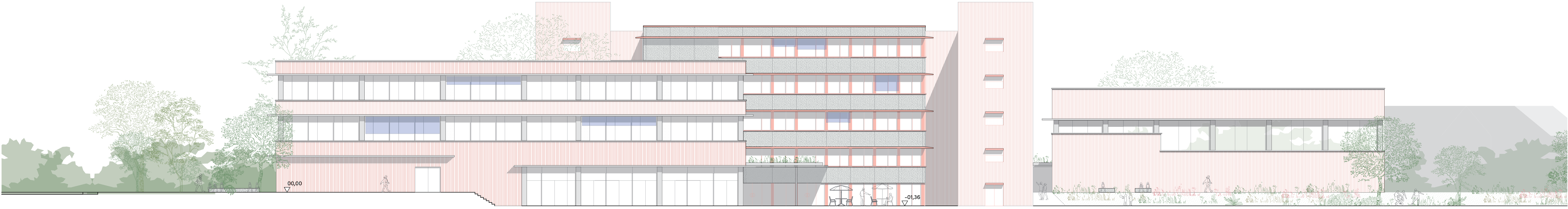
Ansicht West | Maßstab 1:200