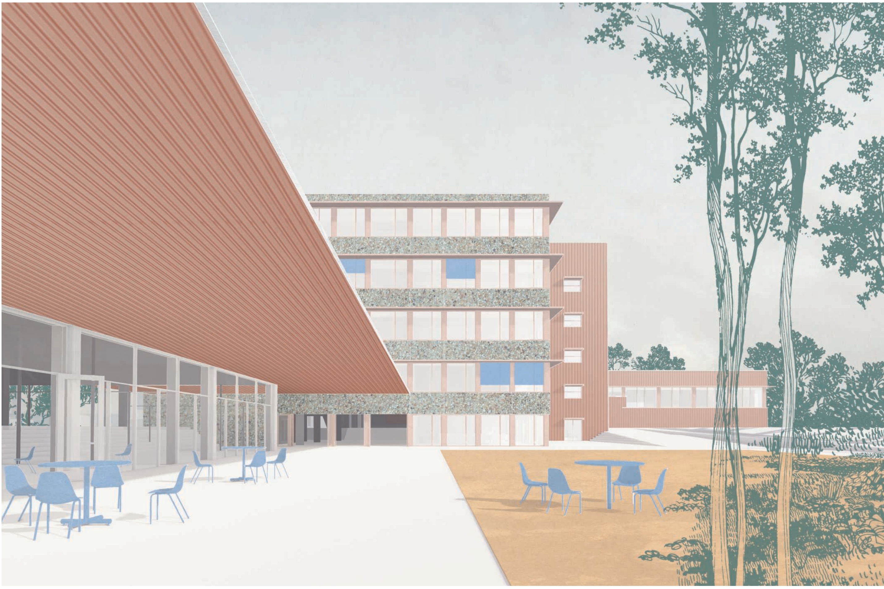
Allgemeiner Unterricht | Die charakteristischen Flurzonen im Bestandsgebäude werden in die neue Lernlandschaft integriert.