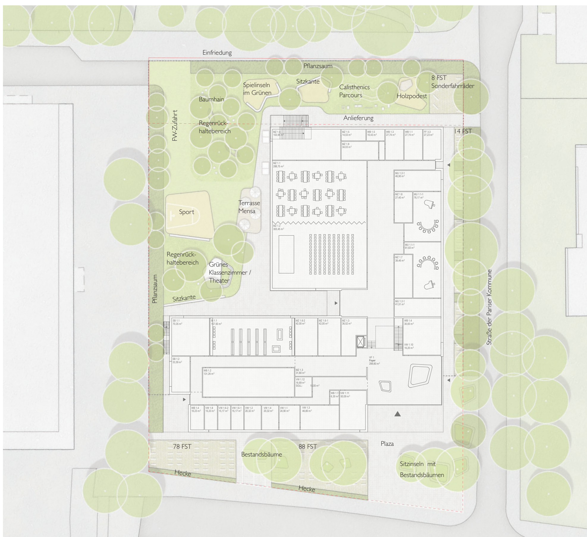
Grundriss Erdgeschoss M 1:500