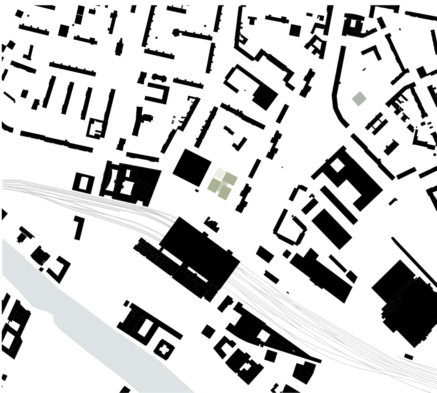
Schwarzplan M 1:6000