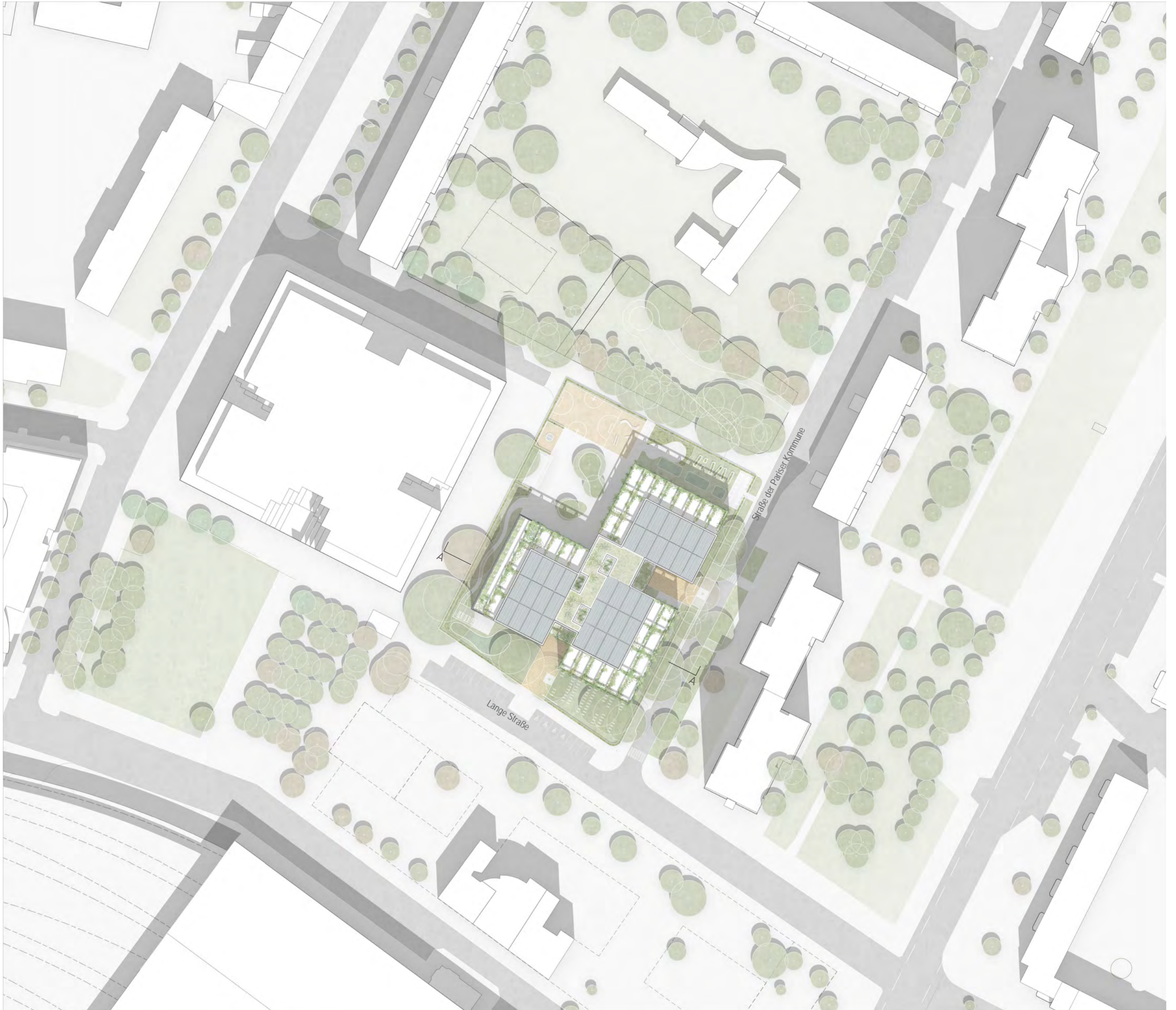
Lageplan M 1:1000