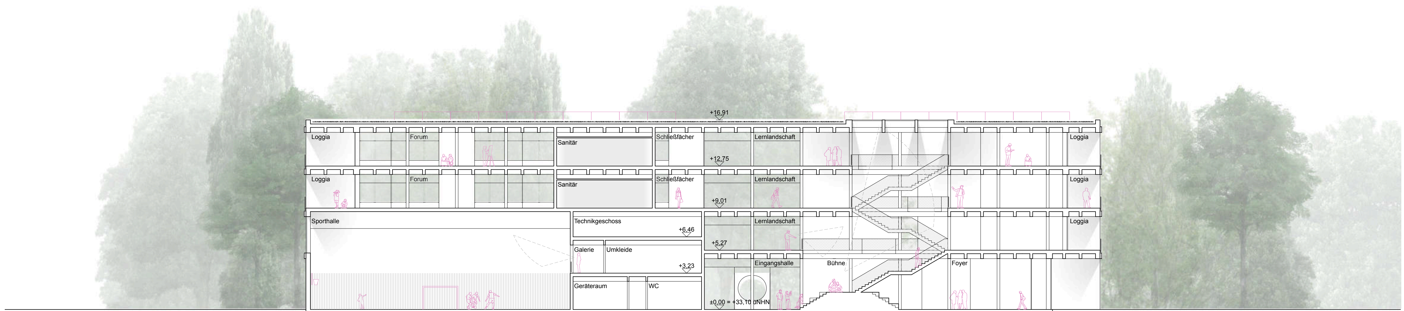
Schnitt B-B 1:200