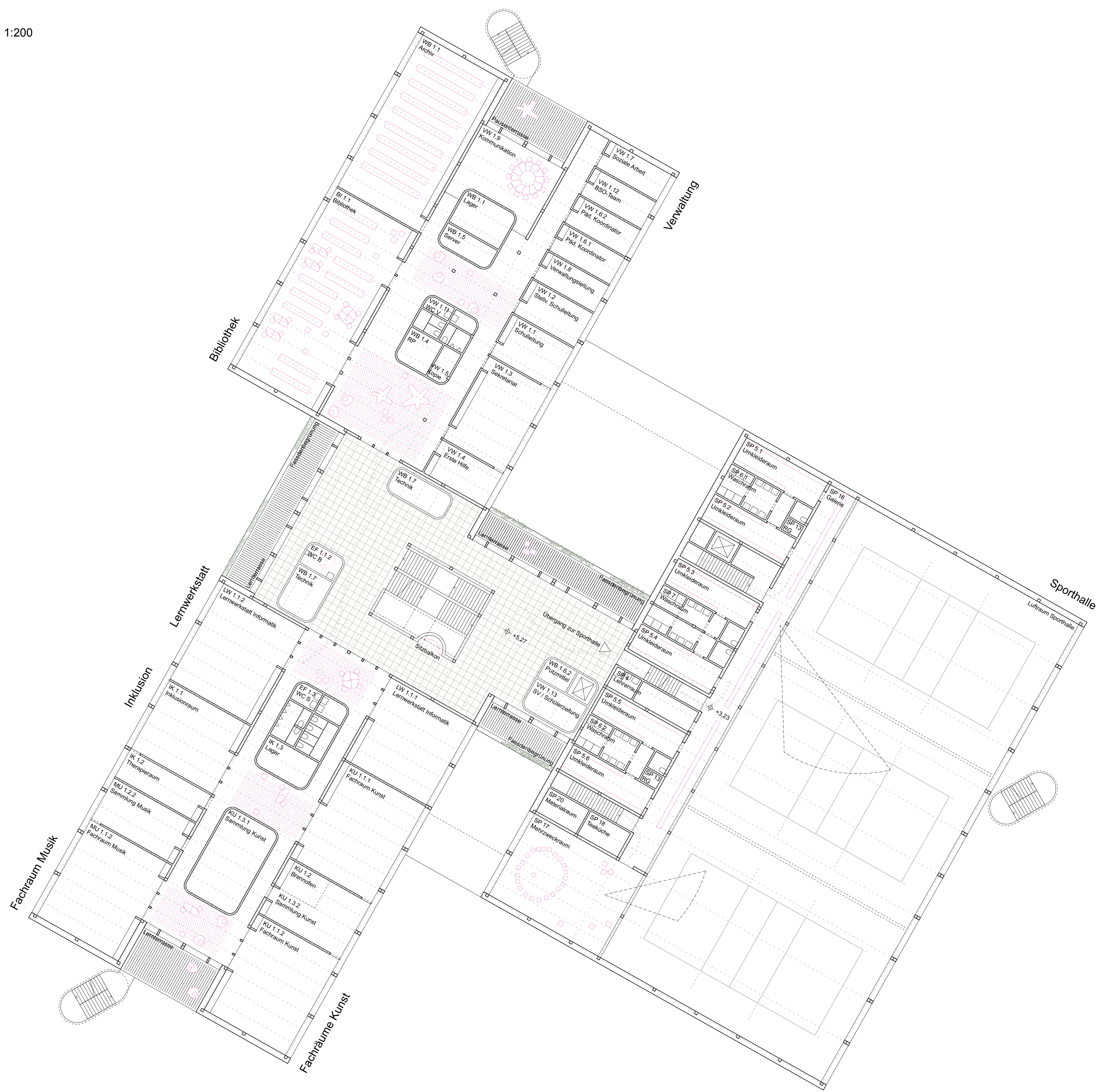
Grundriss 1. Obergeschoss 1:200