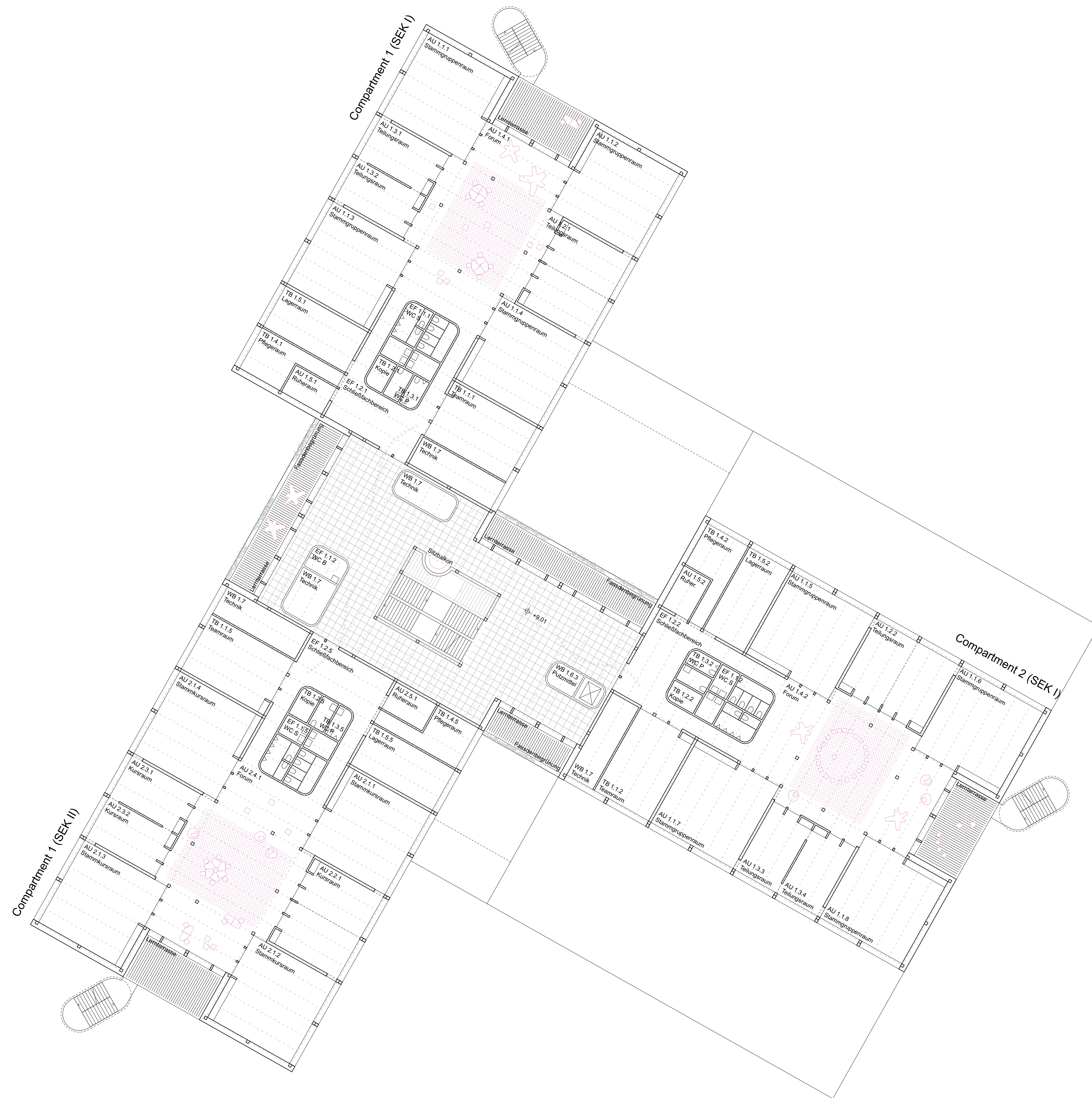
Grundriss 2. Obergeschoss 1:200