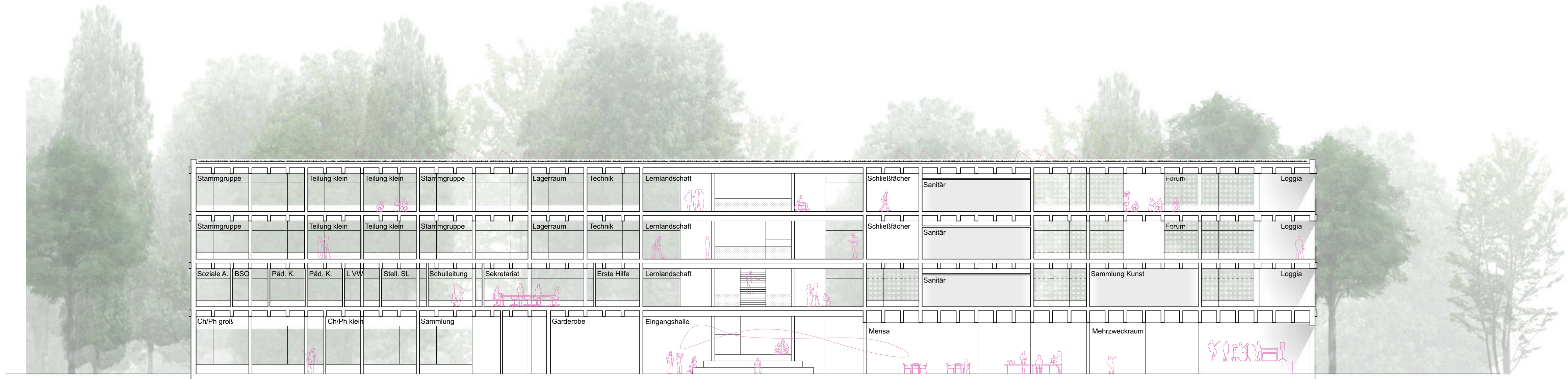
Schnitt A-A 1:200