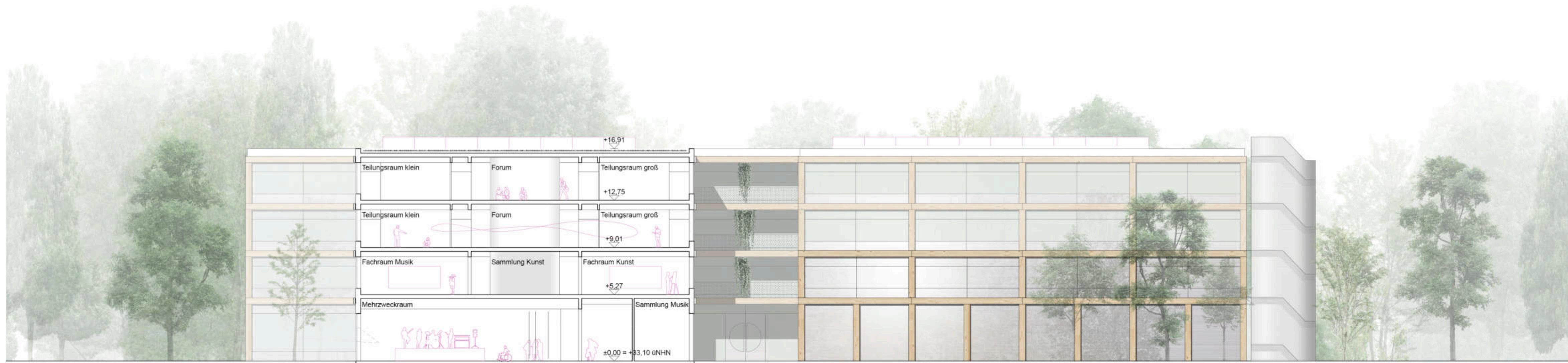
Schnitt C-C 1:200