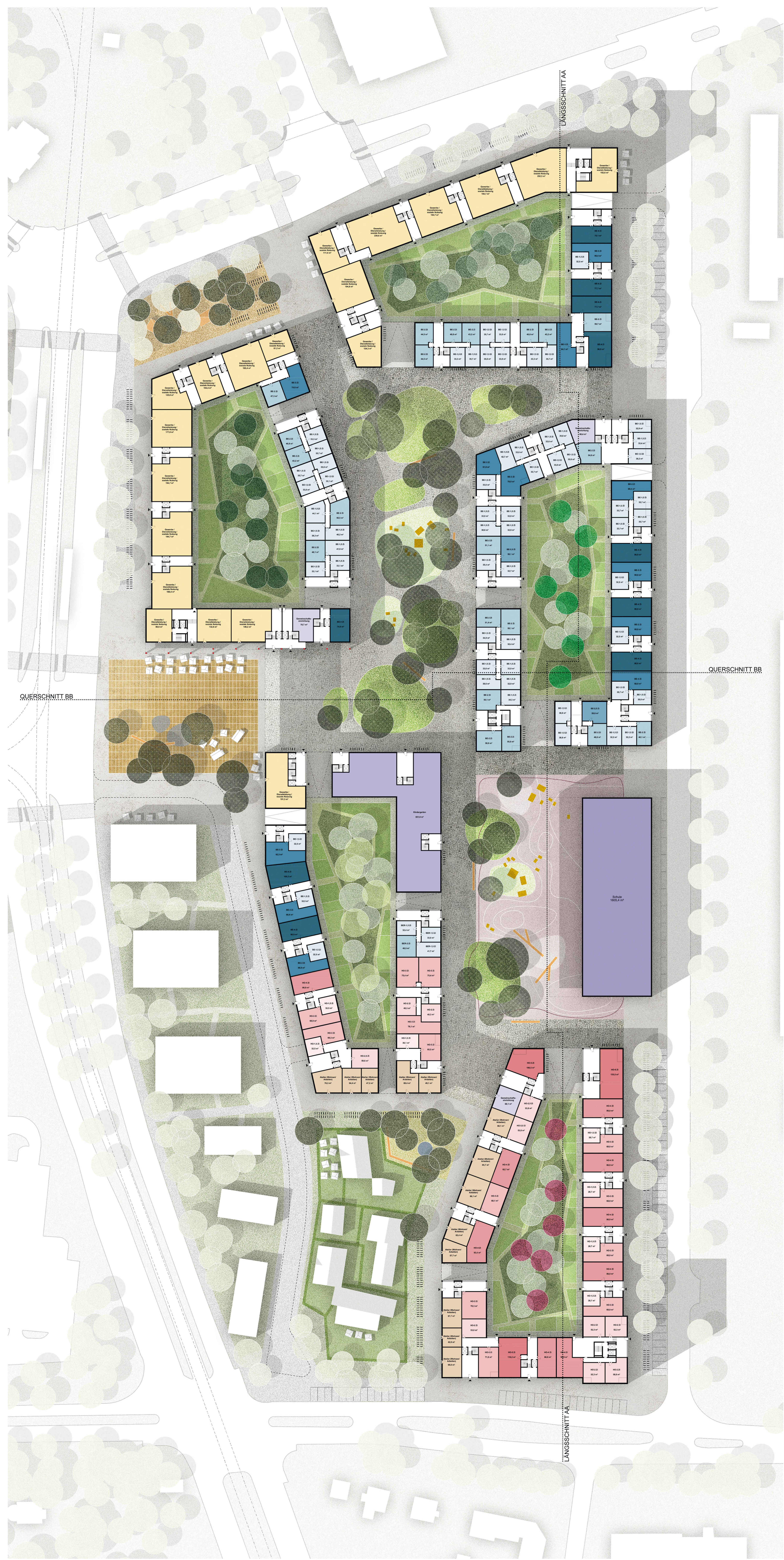
GRUNDRISS ERDGESCHOSS M 1:500