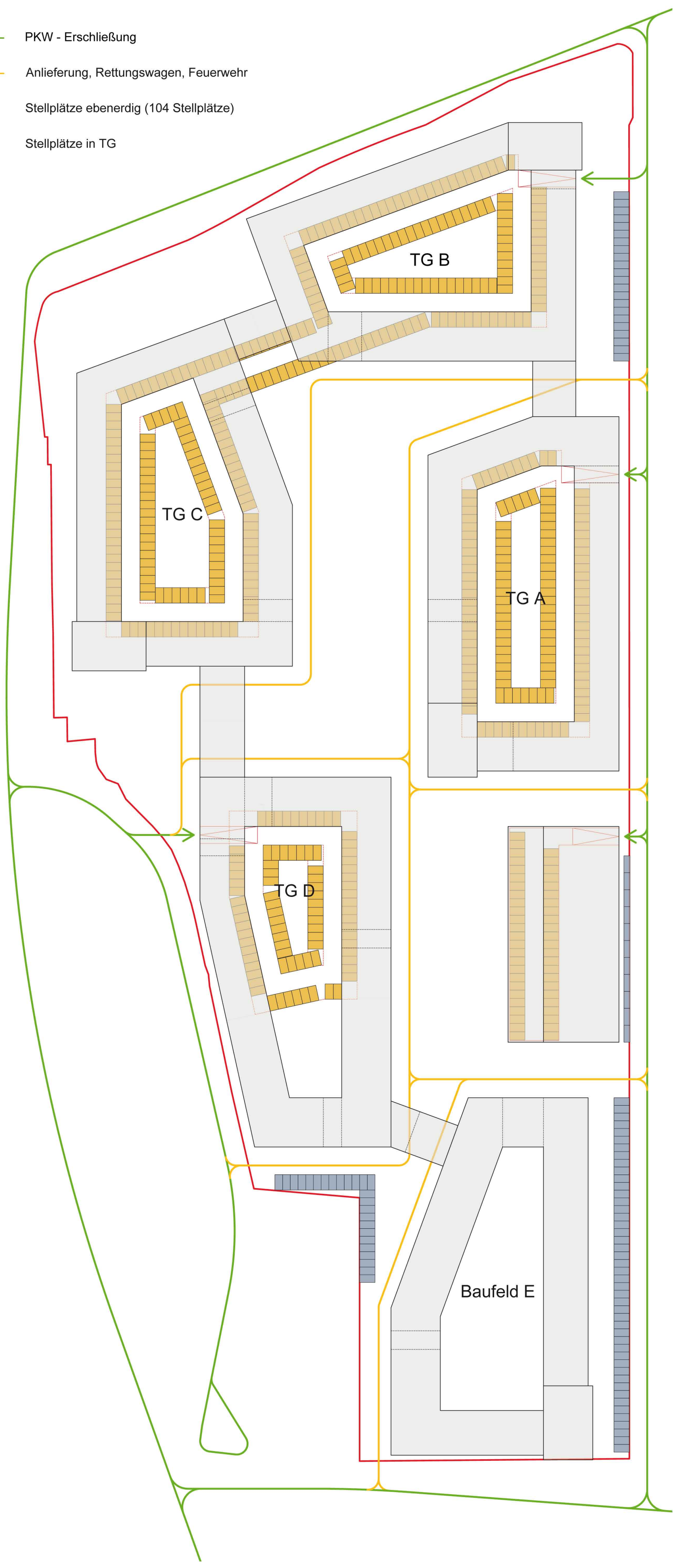
KONZEPTPLAN ERSCHLIESSUNG M 1:1000