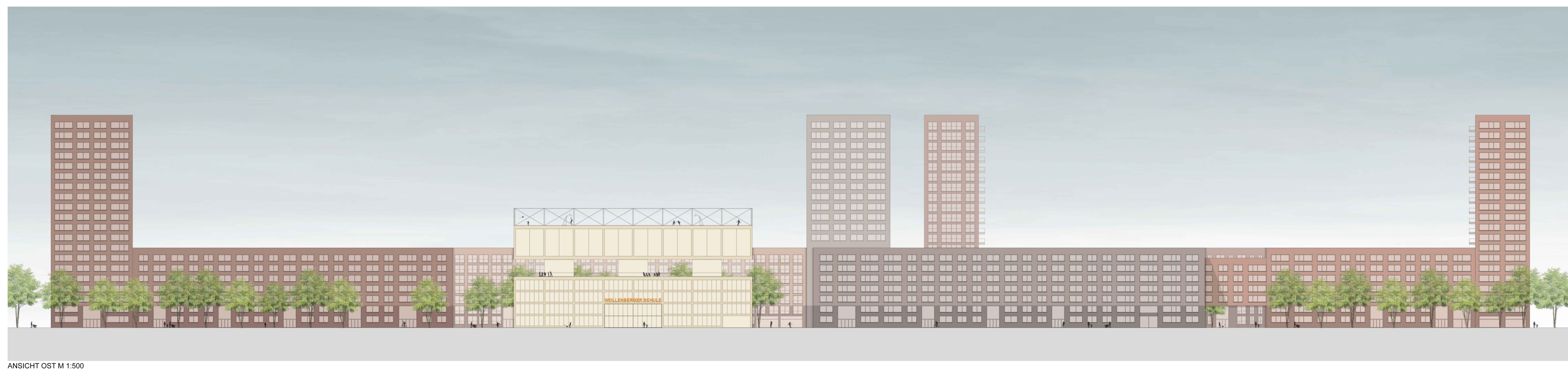
ANSICHT OST M 1:500