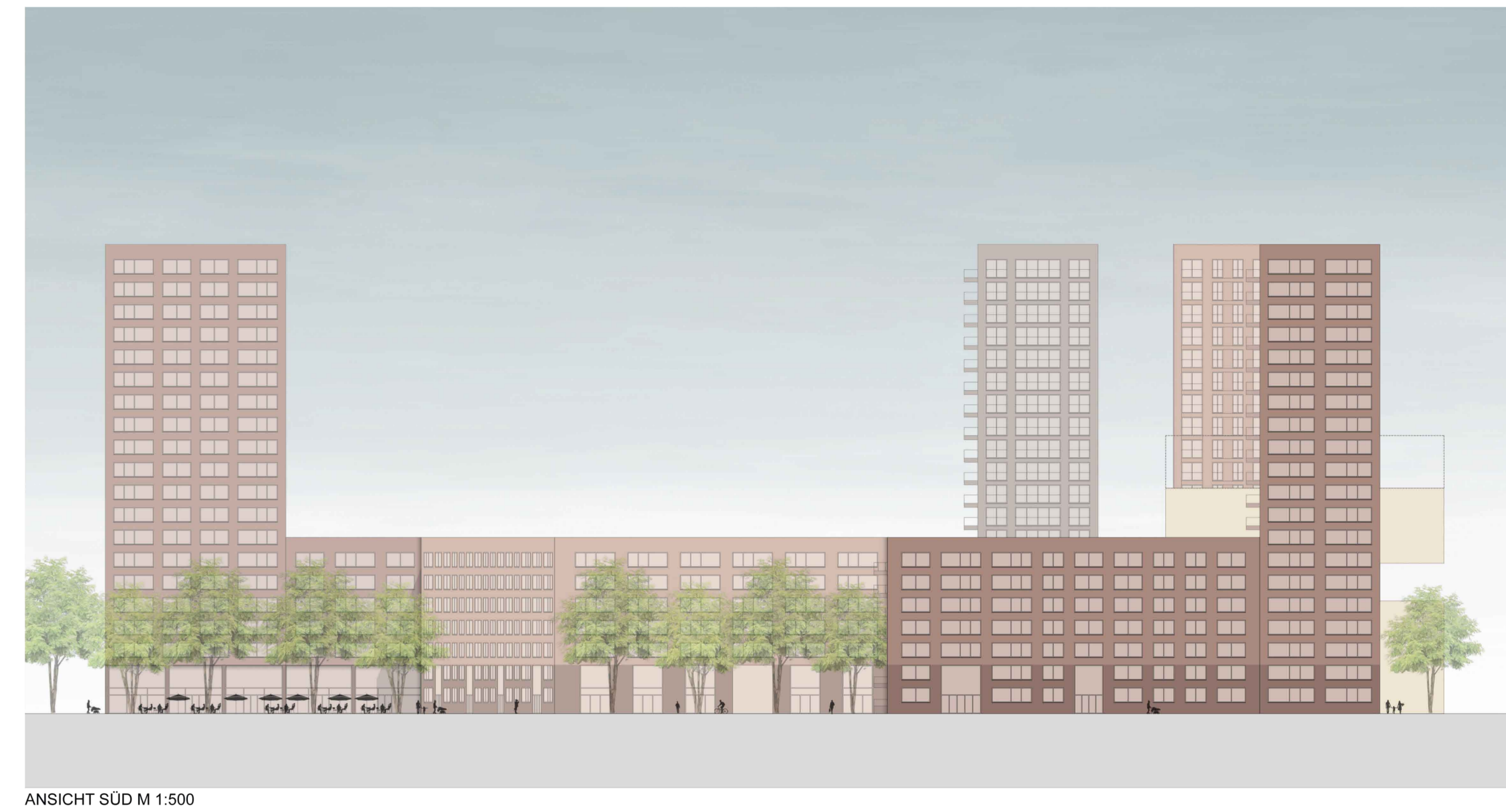
ANSICHT SÜD M 1:500