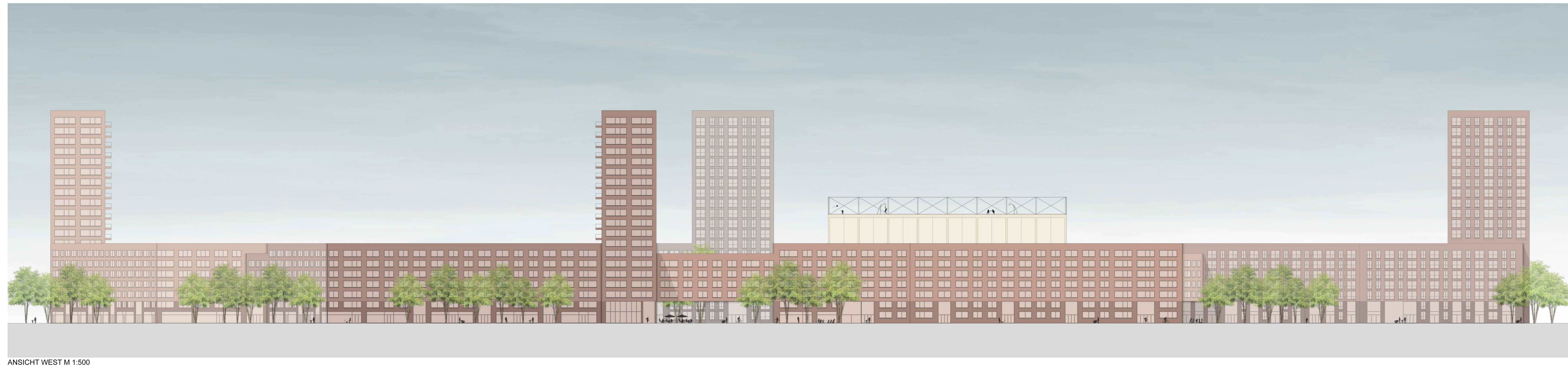
ANSICHT WEST M 1:500