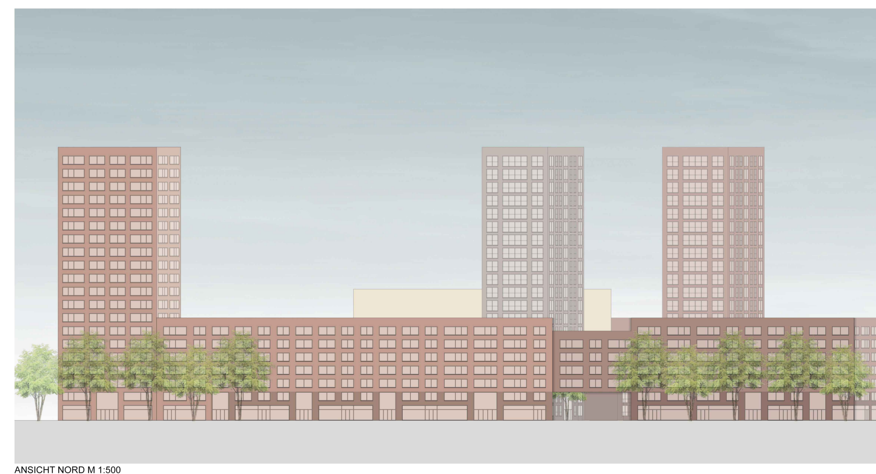
ANSICHT NORD M 1:500