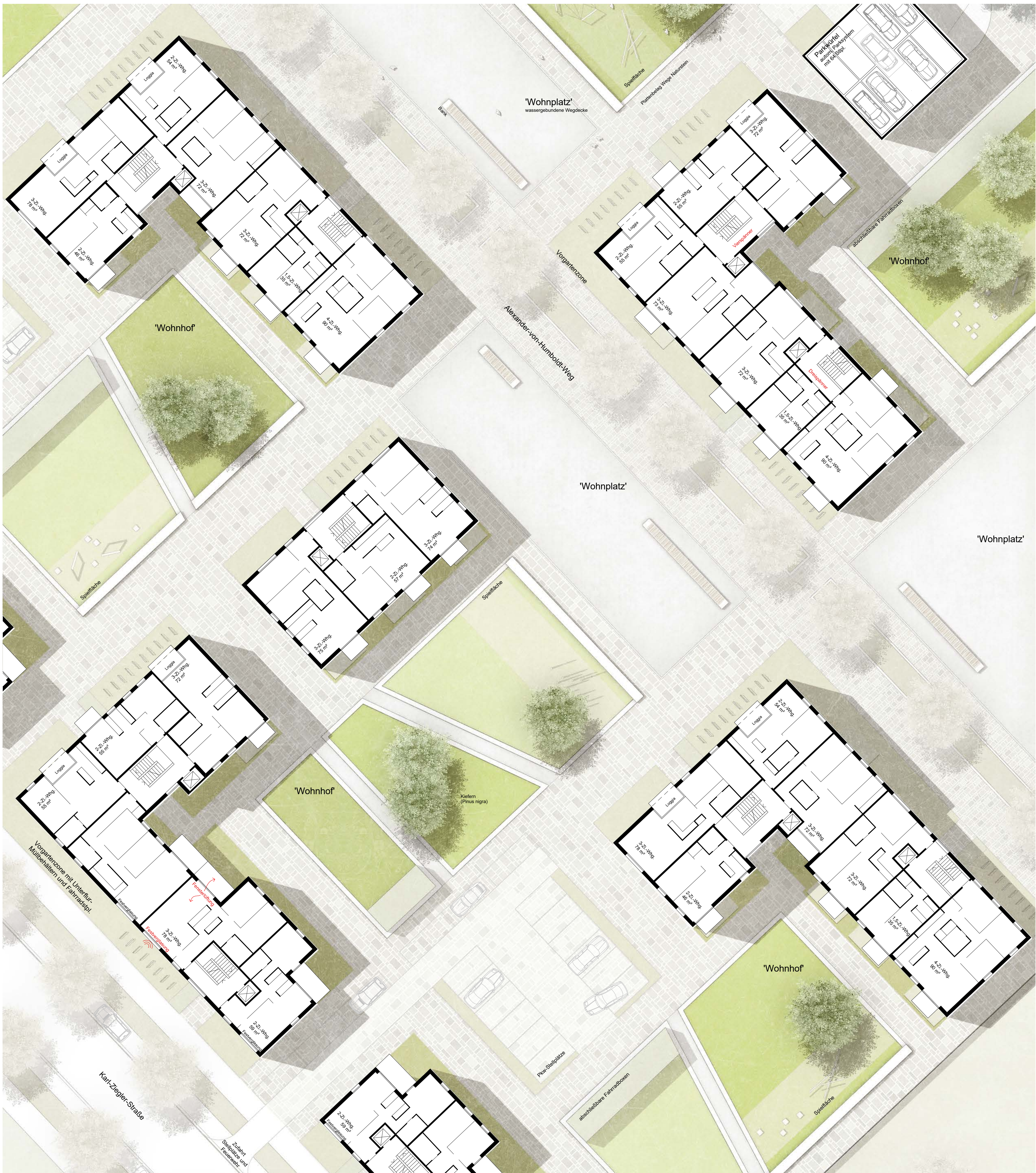
exemplarische Systemgrundrisse Obergeschosse M 1:200