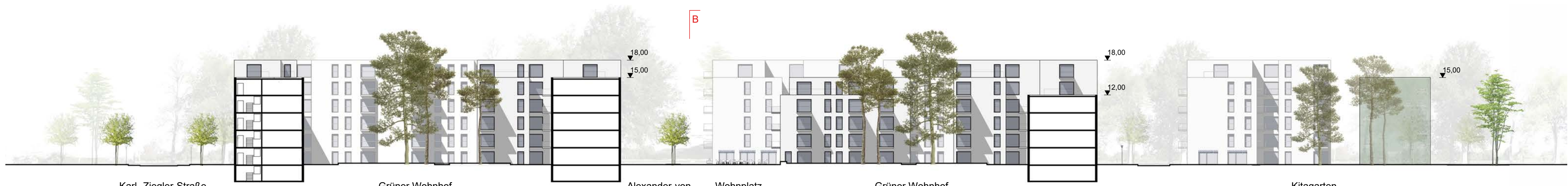
Schnittansicht AA M 1:500