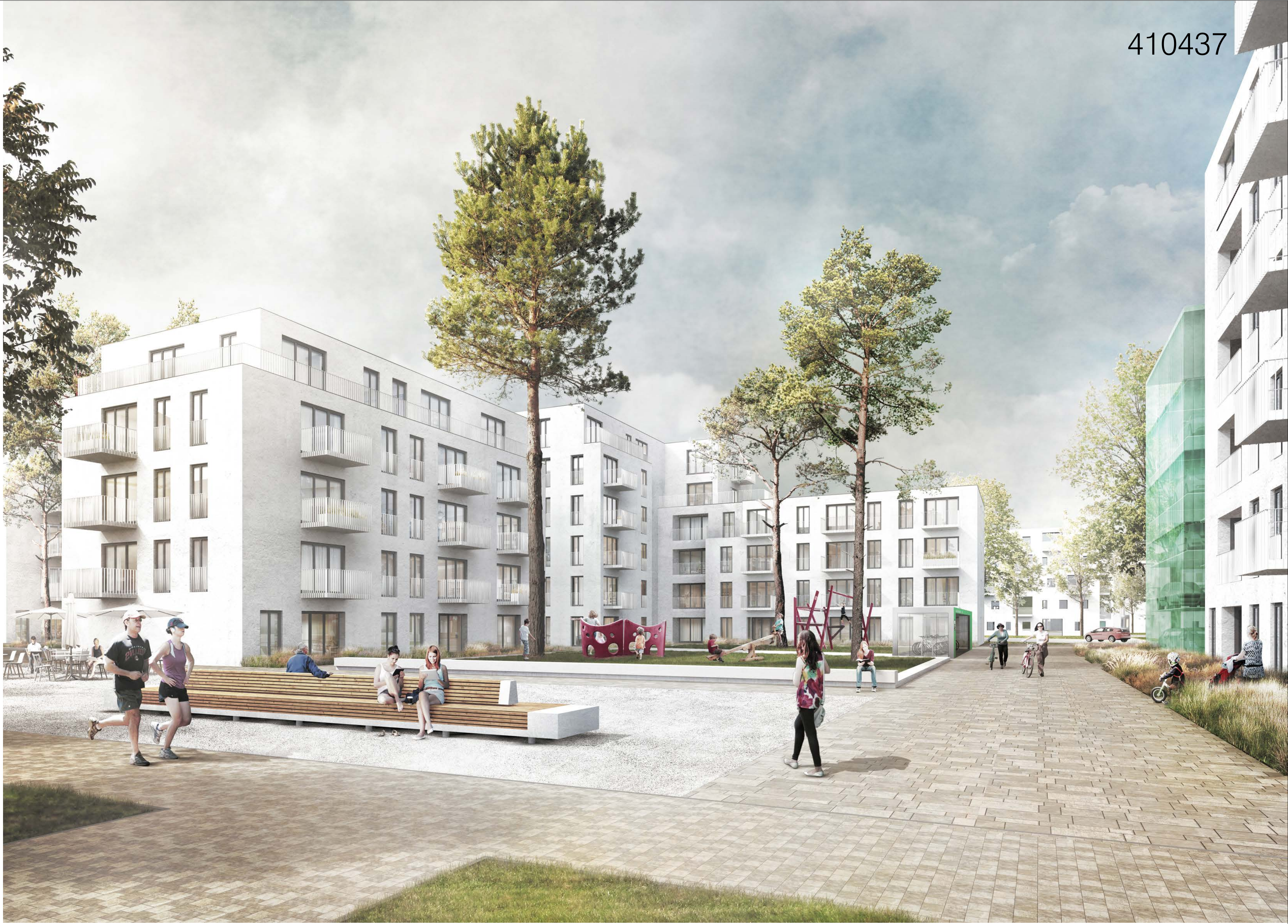
Blick in den Wohnhof